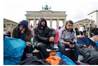
Flüchtlinge Polizei will "Gruppenselbstmord" am Pariser Platz verhindern